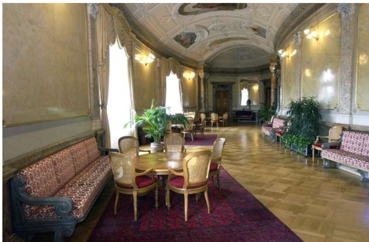
Sala dei passi perduti del Consiglio Nazionale

La mia volontà di continuare a lavorare al servizio del Paese è strettamente legata alla consapevolezza di dimostrare con modestia di saper essere parlamentari svizzeri con responsabilità che riguardano tutto il territorio nazionale. E vi assicuro che agli occhi dei colleghi parlamentari e dell'amministrazione federale nulla ci è dovuto. Infatti, ogni soluzione a favore delle regioni periferiche come il Ticino deve essere conquistata.