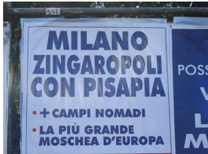
Photo : "Milan ville tsigane avec Pisapia. + camps roms. La plus grande mosquée d'Europe"

Des affiches placardées à Milan pendant la récente campagne électorale pour les municipales agitaient la menace selon laquelle la ville était en passe de devenir une « ville tsigane ». Bien qu'il s'agisse là d'une manifestation extrême de xénophobie, les propos anti-Roms sont en fait chose courante dans la bouche de responsables politiques de plusieurs pays d'Europe. Si cela ne cesse pas, tous les efforts faits pour promouvoir l'intégration des Roms dans la société seront voués à l'échec, et la discrimination et la violence continueront d'être le quotidien de nombreux Roms.